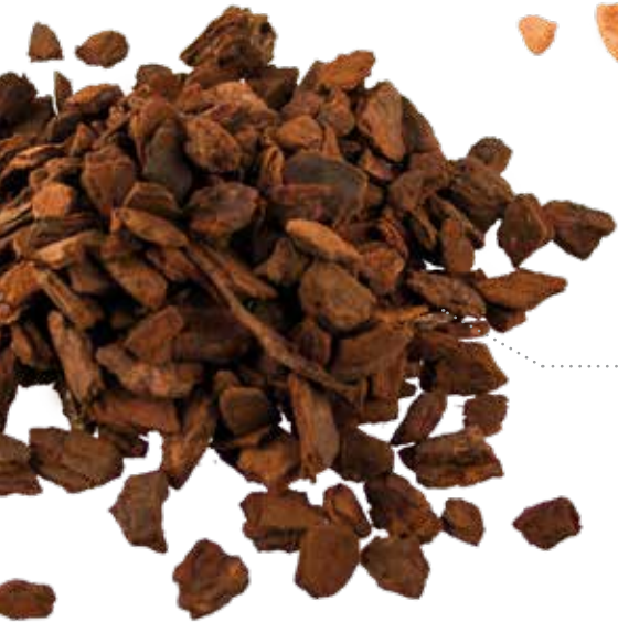
Substrat auf Pinienrindenbasis